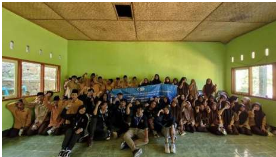
Gambar 2 Partisipasi Siswa MTs Al-Jariyah NW dalam Sosialisasi Pengelolaan Sampah