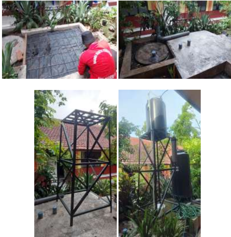
Gambar 6. Pelaksanaan pembangunan penjernihan air buangan

Berikut ini adalah dokumentasi pelaksanaan pembangunan sistem penjernihan air buangan di SMP Negeri 11 Kota Malang yang menjadi langkah konkret dalam mendukung keberlanjutan lingkungan di sekolah.