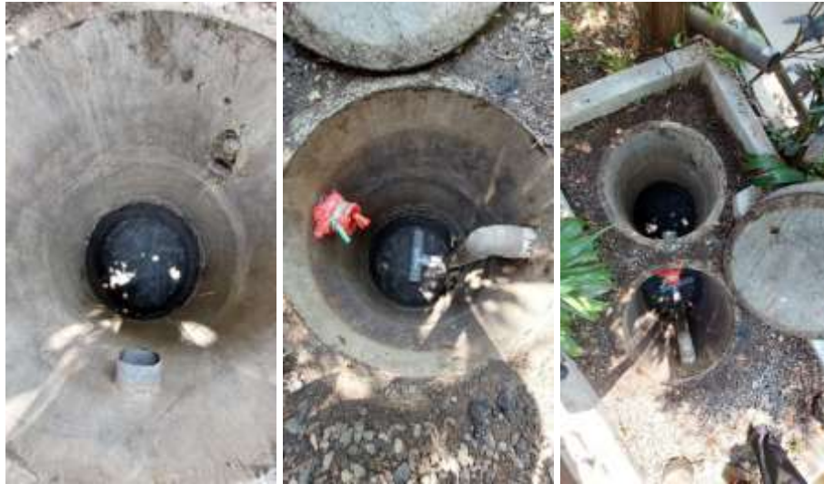
Gambar 4. Pelaksanaan pembangunan sumur resapan

Rancangan sumur resapan yang dibangun di SMP Negeri 11 Kota Malang berjumlah 2 (dua) unit sumur resapan dengan konstruksi berupa buis beton berdiameter 1 meter dengan kedalaman 2 m. Berikut merupakan dokumentasi pelaksanaan pembangunan sumur resapan di SMP Negeri 11 Kota Malang.