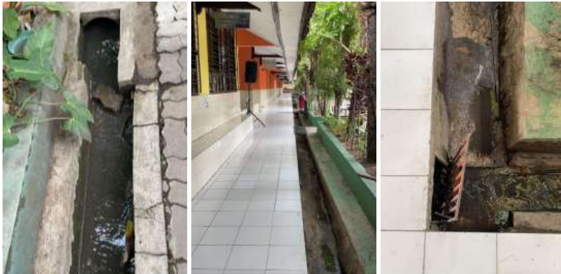
Gambar 2. Kondisi saluran drainase

Hal ini tentu berdampak pada berbagai aktivitas di sekolah dan mengganggu kenyamanan siswa serta guru dalam melaksanakan kegiatan belajar mengajar. Genangan air yang sering terjadi tidak hanya menghambat mobilitas, tetapi juga berpotensi membahayakan keselamatan, terutama saat cuaca buruk. Selain itu, limpasan air yang terus-menerus dapat merusak fasilitas sekolah seperti lapangan olahraga, taman, dan jalan setapak, serta memengaruhi keindahan lingkungan sekolah. Kerusakan tersebut juga dapat berdampak pada citra sekolah di mata masyarakat, karena estetika sekolah yang terjaga adalah salah satu faktor penting dalam menciptakan lingkungan yang nyaman dan kondusif untuk belajar.