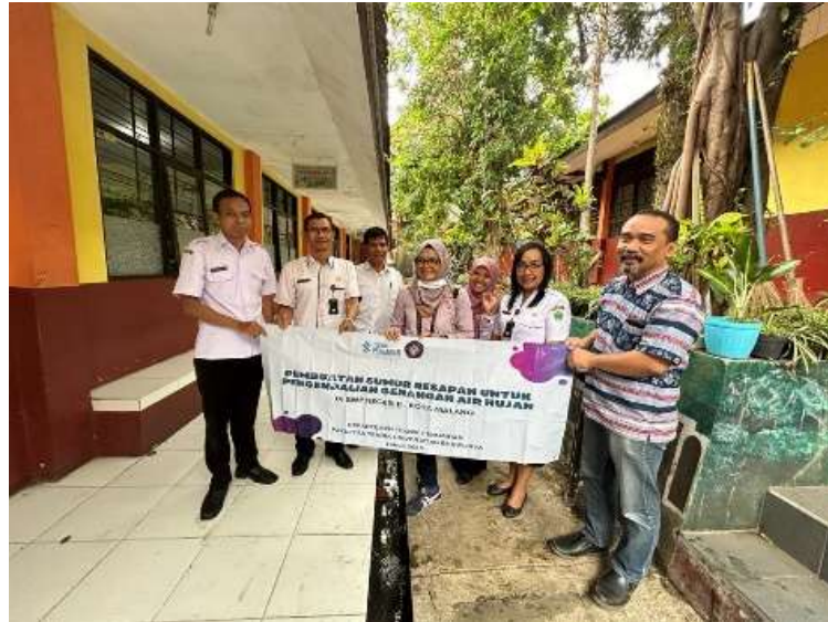
Gambar 1. Persiapan survei di SMP Negeri 11 Kota Malang

tinggi. Akibatnya, ketika hujan deras, saluran drainase yang ada tidak dapat menampung air dengan optimal, menyebabkan limpasan air yang mengarah pada genangan di area sekolah.