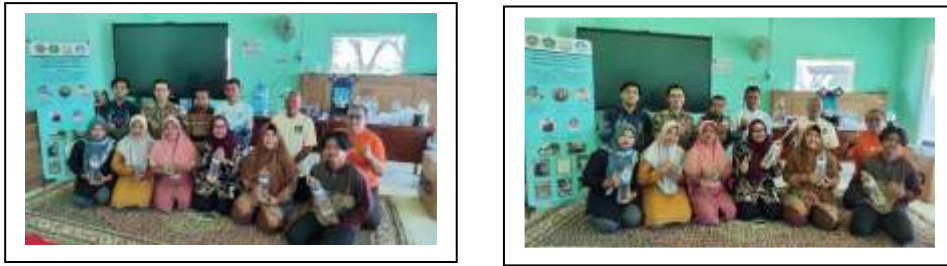
Gambar 5. Pelatihan Pemasaran