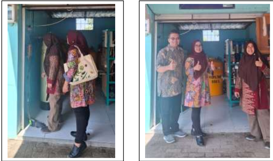
Gambar 3. Observasi alat BWRO

Kegiatan persiapan mencakup koordinasi dengan mitra, penyusunan jadwal kegiatan, dan pengembangan modul pelatihan sesuai kebutuhan peserta. Survei awal dilakukan untuk memetakan kendala dan potensi mitra sehingga materi pelatihan lebih relevan dan aplikatif.