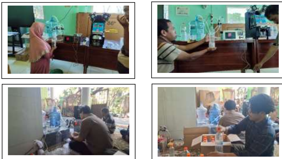
Gambar 6. Pendampingan Produksi