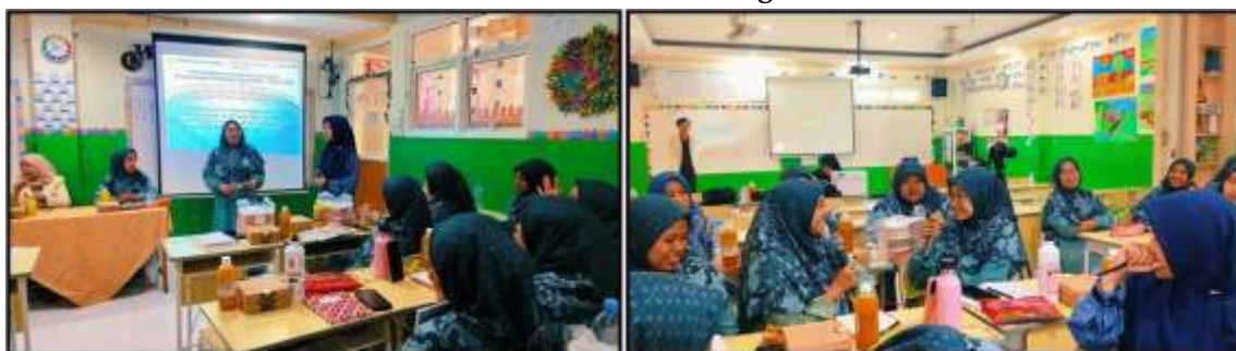
Gambar 5. Proses pelatihan dilakukan secara interaktif dengan model praktik langsung