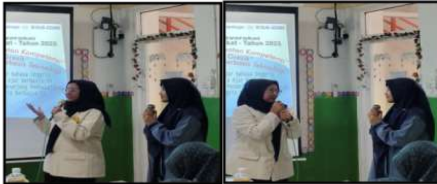
Gambar 13. Guru menyampaikan feedback dari praktek dan materi yang diberikan selama pelatihan

inggris sangat bermanfaat, terutama untuk program bilingual di SDI Az-Zahro. Harapan kedepannya, semoga pelatihan-pelatihan atau kerja sama seperti ini bisa terus diadakan dengan materi yang lebih mendalam lagi dan bisa langsung praktek untuk penggunaan media pembelajaran seperti Canva. Bagaimana cara membuat game di Canva, karena selama pelatihan belum dipraktikkan cara langsungnya. Jadi langsung ada game -nya di Canva.