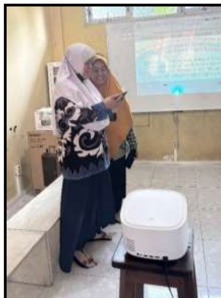
Gambar 10. Guru diberi pelatihan bagaimana cara menggunakan smart technology