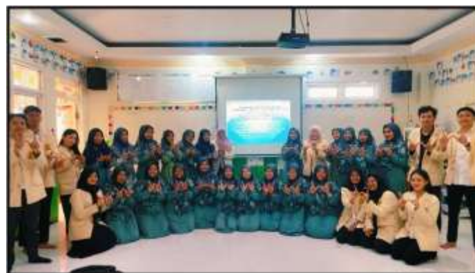
Gambar 4. 100% Guru SD AZ-ZAHRO Gresik mengikuti kegiatan pelatihan