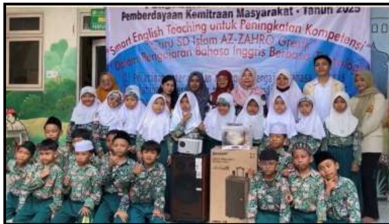
Gambar 9. Pemberian smart technology pendukung pembelajaran smart english teaching

Pemberian alat ( tools ) yang digunakan dalam pembelajaran dengan menggunakan smart technology oleh tim pelaksana PkM dilakukan sebelum praktek penggunaannya (Gambar 9). Guru diberi pelatihan bagaimana cara menggunakan smart technology untuk proses pembelajaran bahasa inggris untuk siswa baik indoor maupun outdoor (Gambar 10). Guru mempraktekkan penggunaan smart technology yang dilakukan di kelas langsung untuk proses pembelajaran bahasa inggris. Guru mempraktekkan untuk melakukan pembelajaran menggunakan smart technology . Praktek pembelajaran yang dilakukan oleh Guru tersebut tetap didampingi dan dimonitor oleh tim pelaksana PkM dan Mahasiswa (Gambar 11).