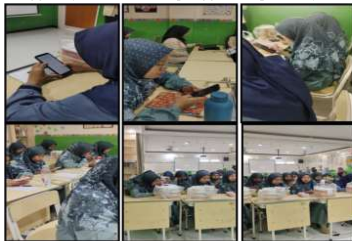
Gambar 12. Proses pembelajaran bahasa inggris langsung menggunakan video pembelajaran yang disimpan Guru di smart phone

Proses pembelajaran bahasa inggris langsung menggunakan video pembelajaran yang telah disimpan Guru di smart phone (Gambar 12). Konten di smart phone akan langsung ditayangkan melalui smart LCD. Suara yang dihasilkan langsung di koneksikan melalui bluetooth ke smart active speaker yang dapat ditempatkan pada posisi yang strategis, karena smart active speaker sudah dilengkapi dengan baterai yang bertahan hingga 12 jam lebih untuk penggunaan pembelajaran.