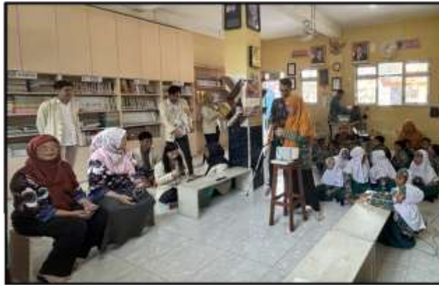
Gambar 11. Praktek pembelajaran Guru didampingi dan dimonitor tim pelaksana PkM dan Mahasiswa