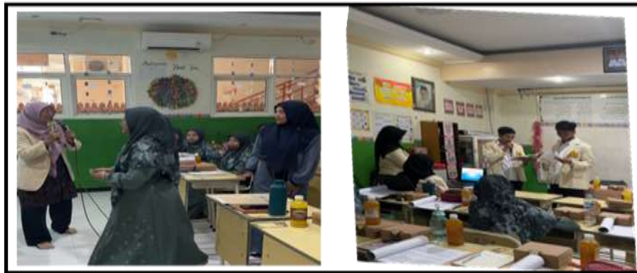
Gambar 3. Pelatihan langsung diberikan oleh tim pelaksana PkM dan mahasiswa