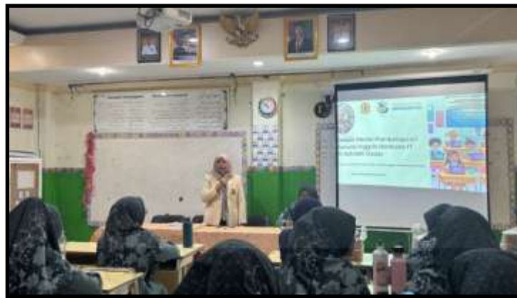
Gambar 7. Pelatihan model pembelajaran SELM