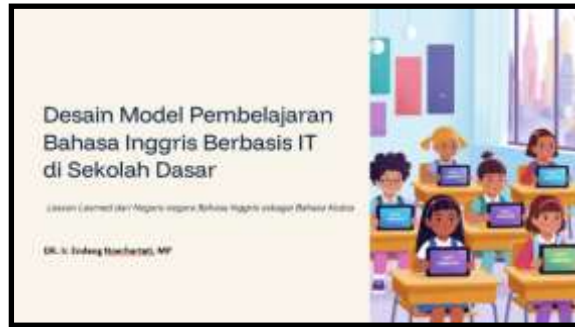
Gambar 6. Model pembelajaran SELM