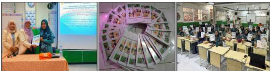
Gambar 2. Penyerahan modul Practical English Conversation

Pelatihan langsung diberikan oleh tim pelaksana PkM dan mahasiswa (Gambar 3) dengan menggunakan Modul Pembelajaran Bahasa Inggris yang telah diberikan kepada seluruh guru SD Islam AZ-ZAHRO Gresik. 100% Guru SD AZ-ZAHRO Gresik mengikuti kegiatan pelatihan tersebut, karena pelatihan dilakukan dihari libur (Gambar 4). Proses pelatihan dilakukan secara interaktif dengan model praktik langsung untuk mengetahui Peningkatan kemampuan guru dalam memiliki keterampilan kemampuan mengajar Bahasa inggris (Gambar 5).