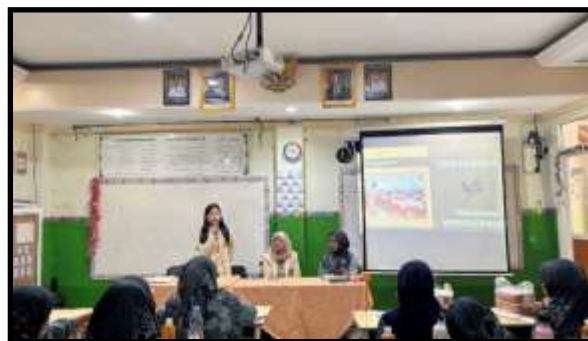
Gambar 8. Pemberian materi membuat media pembelajaran menggunakan tool CANVA yang dikombinasikan dengan prompt generative artificial intelligence Sumber : Dokumentasi kegiatan