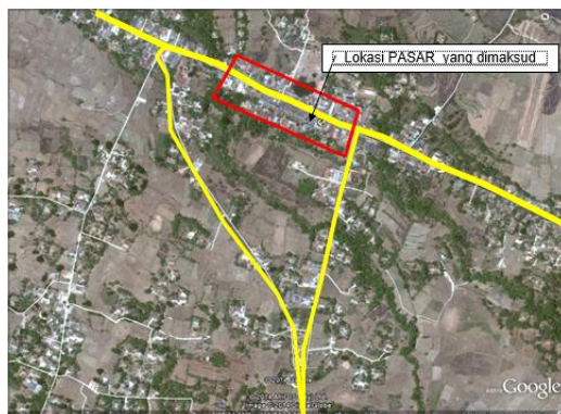
Gambar 3. Jaringan Jalan di Pasar Tanah Merah Bangkalan

Secara lebih terperinci, batas fisik lokasi Pasar Tanah Merah Bangkalan adalah sebagai berikut :