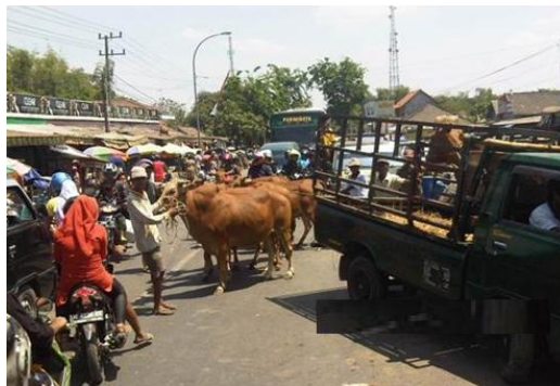
Gambar 4 Suasana Kemacetan di Pasar Tanah Merah

Lokasi Pasar Tanah Merah Bangkalan merupakan lahan dengan penduduk yang heterogen, dimana pada kawasan tersebut sudah banyak pendatang dari luar daerah tersebut yang bermukim di desa tersebut sehingga terjadi interaksi antara penduduk asli dan para pendatang yang bermunculan di lokasi tersebut. Mata pencaharian penduduk pendatang kebanyakan sebagai pekerja di kawasan industri dan perkantoran yang letaknya cukup jauh dari tempat tinggal. Sehingga terlihat bahwa kondisi jalan yang merupakan jalan utama menuju ke lokasi Pasar Tanah Merah Bangkalan pada saat kegiatan relatif lebih ramai dibandingkan dengan sebelumnya khususnya pada setiap Hari Jumat (pasar palawija) dan Hari Sabtu (pasar sapi).