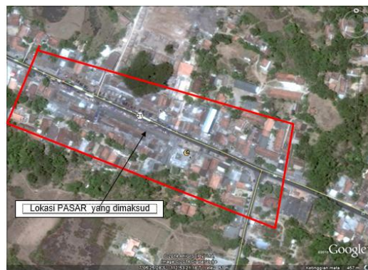
Gambar 2. Lokasi Pasar Tanah Merah Bangkalan