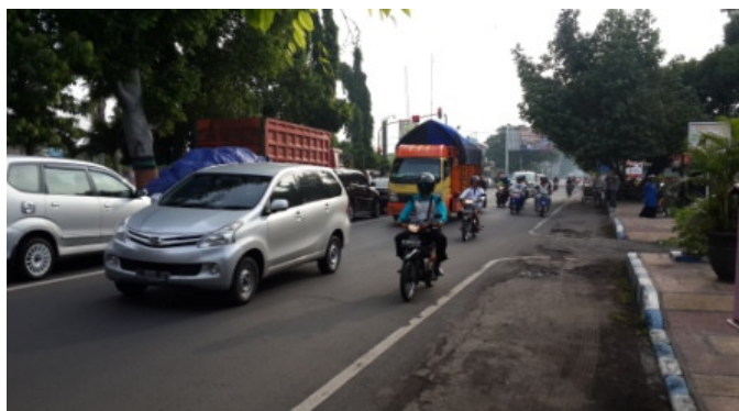
Gambar 3 Jl. Panglima Sudirman – Jl. Soekarno Hatta Kota Probolinggo