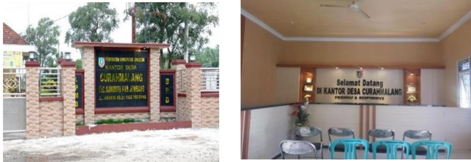
Gambar 2. Balai Desa Curahmalang Tampak Depan

Sesuai data Badan Pusat Statistik 2018, jumlah masyarakat Desa Curahmalang memiliki penduduk sebanyak 6.802 jiwa yang terhitung dengan perincian terdapat 3.356 Perempuan dan 3.466 Laki-laki. Aspek finansial di Desa Curahmalang dikatakan sudah makmur, karena selain tersedia ladang luas yang sebagian besar masyarakatnya berprofesi sebagai petani juga terdapat pekerja seperti pengusaha tas berkat, Penjahit, Peternak ikan, guru honorer, PNS, pengusaha sepatu, wiraswasta juga tersedia industri pabrik-pabrik kecil berdiri disana.