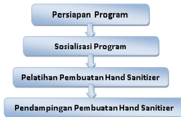
Gambar 1. Flow map kegiatan

Metode pelaksanaan pelatihan pembuatan hand sanitizer dari kulit bawang merah yang telah dilakukan tersaji dalam rangkaian tahapan yang disusun secara sistematis, berikut adalah gambaran flow map yang telah berjalan: