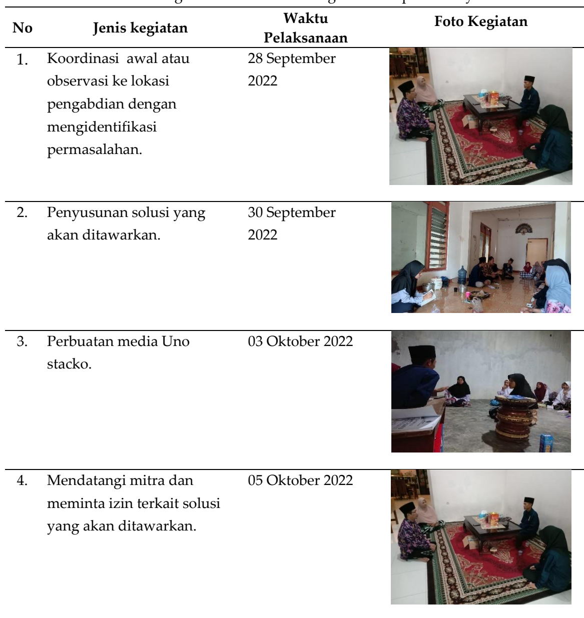
Tabel 1. Kegiatan Pelaksanaan Pengabdian Kepada Masyarakat

Desa Sentul Kecamatan Tembelang Kabupaten Jombang. Dengan jumlah 46 orang, pada kegiatan penerapan ini yang telah dioleh kami sebagai pemateri dalam pelaksanaan kegiatan pengabdian pada masyarakat. Teknologi yang kami gunakan pada pelaksanaan kegiatan pengabdian pada masyarakat adalah dengan menggunakan media Uno stacko dengan menggunakan media tersebut bisa membantu untuk mempermudah pembelajaran khususnya pada ilmu tajwid. Pelaksanaan kegiatan pengabdian pada masyarakat ini melalui pelatihan dan penerapan media Uno stacko untuk meningkatkan pemahaman dan semangat dalam pembelajaran ilmu tajwid terhadap para santri yang dilakukan di pondok pesantren Hidayatul Qur'an desa Sentul dengan tahapan pelaksanaan kegiatan sebagai berikut Tabel 1. Kegiatan Pelaksanaan Pengabdian Kepada Masyarakat: