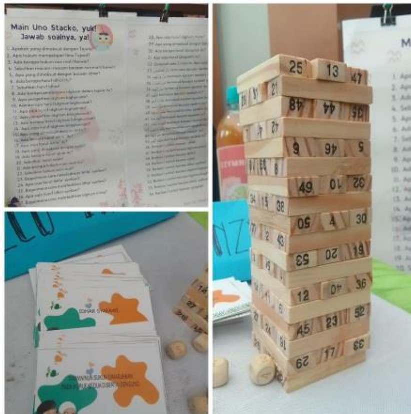
Gambar 1. Produk Uno Stacko